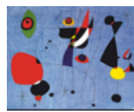
« Le monde »

Après un ou deux visionnements, demander aux élèves ce qu'ils pensent des silhouettes et de leurs transformations.