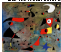
« Femme oiseau »

Les tableaux colorés peuvent faire penser à l'oeuvre de Miro .